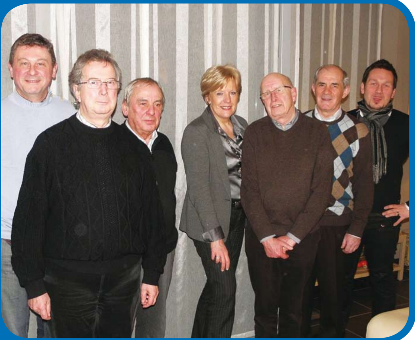
Foto: Het zevenkoppige "patio-Virga-Jesse-Comité"

VIRGA JESSE FEESTEN HASSELT 13 - 29 AUGUSTUS 2010